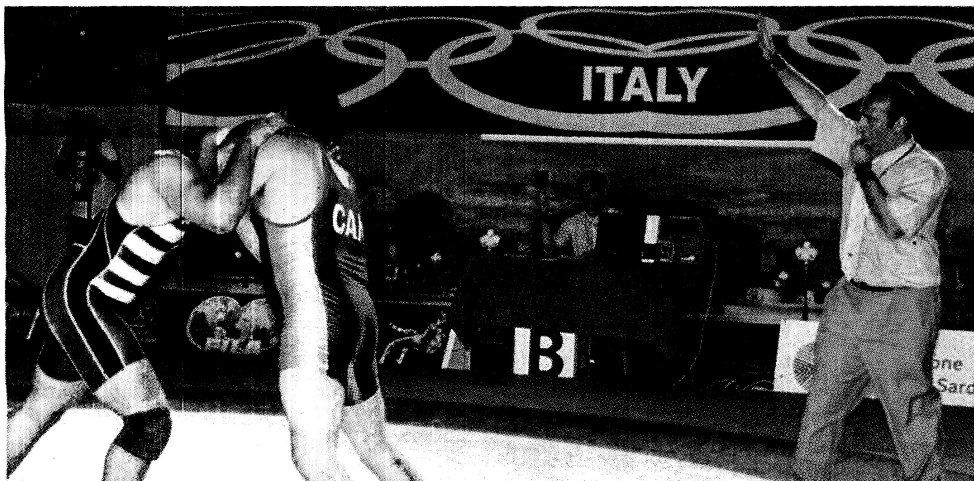
Un momento dei combattimenti del trofeo Città di Sassari di lotta olimpica

ci». Accanto al killer del mondiale, a proposito di Ducati, scatterà con il secondo tempo Andrea Iannone. Di flop si può invece parlare a proposito della qualifica di Rossi. Il nove volte iridata che festeggia la sua trecentesima partenza in gara nel GP d'Italia, non è riuscito a concretizzare le qualifiche. Un errore di scelta dei pneumatici ha relegato Valentino in decima posizione e in quarta fila.