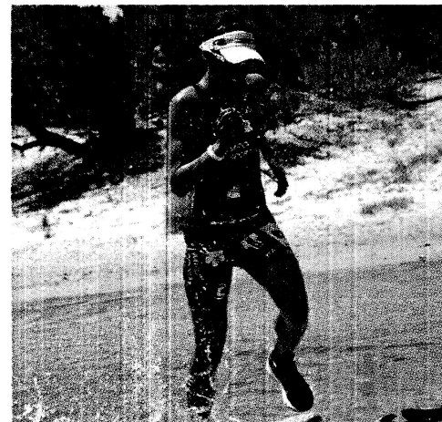
Un'immagine della scorsa edizione del TNatura