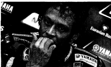
Giornata da dimenticare per Valentino Rossi