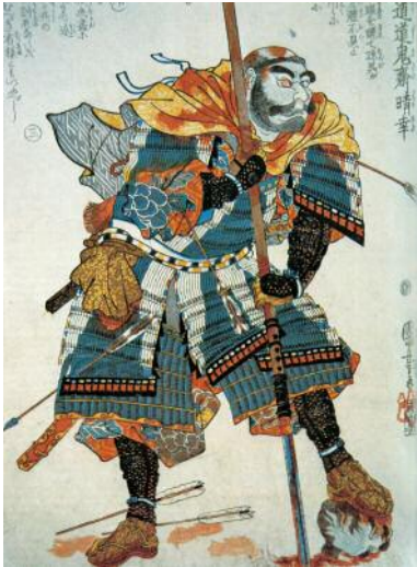
Samurai, di Kuniyoshi