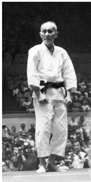
Hironori Otsuka (1892-1982)

Lo shito si deve a Kenwa Mabuni (1889-1952). Il nome shito deriva dalla contrazione dei nomi in giapponese dei suoi due insegnanti, Itosu (Shuri-te) e Higaonna (Naha-te). Mabuni studiò il kempo e apprese la forma di Shaolin chiamata gru bianca , quindi approfondì l'uso delle armi. Durante una visita a Okinawa