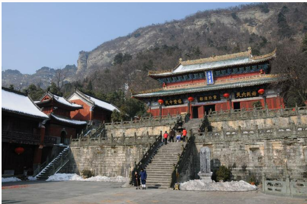
Il monastero della Nuvola purpurea . Nel 1994 i monasteri dei monti Wudang sono stati inclusi dall'UNESCO nell'elenco dei Patrimoni dell'Umanità