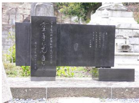
Il monumento a Gichin Funakoshi (Engakuji, Kamakura)

Sul monumento che lo ricorda nel tempio zen di Engaku a Kamakura si legge questa massima: «Karate ni sente nashi», ossia «Non c'è tecnica offensiva nel Karate».