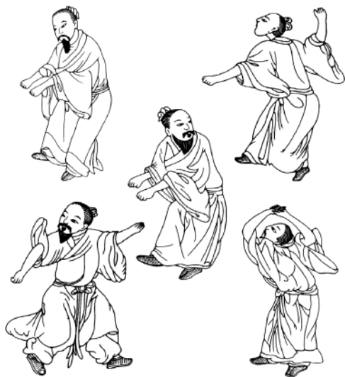
Scuola Hua To: wuqinxing (i cinque animali)

Sotto l'infatuazione per la civiltà e i costumi occidentali, il budo subì una rapida decadenza (anche per l'enorme diffusione delle armi da fuoco) e non pochi esperti, rimasti senza allievi, per sopravvivere in una società profondamente mutata dovettero esibirsi a pagamento in squallidi locali o finirono nella malavita. I Maestri non tramandavano più il loro sapere, portandosi nella tomba i segreti della loro scuola ( ryu ): un grande patrimonio di nobili tradizioni stava per scomparire. Questo era il triste spettacolo che si presentava a Jigoro Kano .