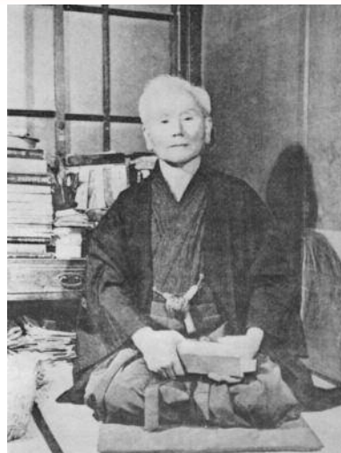
Gichin Funakoshi (1868-1957)

Solo con l'arrivo di Funakoshi il karate poté diffondersi capillarmente nel paese del Sol Levante.