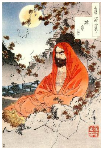
Bodhidharma (Daruma / Ta-mo), stampa di Yoshitoshi, 1887