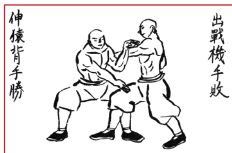
Disegno tratto dal Bubishi

Agli abitanti venne imposto un nuovo tributo, che si sommava a quello che continuarono a pagare alla Cina. Fu inoltre rinnovato il divieto di possedere armi e persino gli utensili di uso quotidiano come bastoni e falcetti (che potevano trasformarsi in armi letali) dovevano essere chiusi nei magazzini durante la notte, costringendo gli abitanti a dedicarsi in segreto allo studio di una forma di autodifesa da