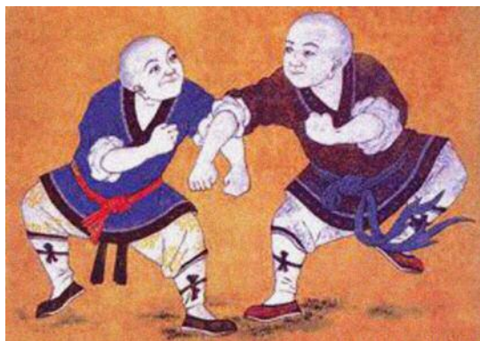
Monaci guerrieri (affresco nel monastero di Shaolin)

Attraverso i secoli centinaia di stili “esterni” e decine di “interni” si sono formati, mescolati e sovrapposti. La storia del kung-fu, come tutta la storia del pensiero cinese, è talmente complessa da scoraggiare un maggior approfondimento.