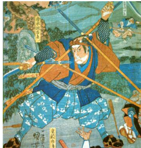
Il leggendario spadaccino Miyamoto Musashi (ukiyo-e di Kuniyoshi)

“Samurai”, dal 1976 / nuova serie: 2006 (I) - 2015 (X)