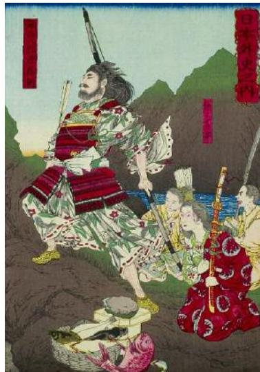
Tametomo Minamoto, di Kobayashi

«Se qualcuno chiede qual è lo spirito dello Yamato, rispondi: è un fiore di ciliegio che profuma il sole del mattino».