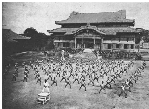
Esercitazione di karate davanti al castello di Shuri

basava su una sintesi di arti marziali locali, cinesi, giapponesi. Mise a punto il kata Bassai , poi si dedicò all'insegnamento del suo metodo e fu maestro di Anko / Yasutsune Azato (1827-1906), a sua volta maestro di Funakoshi. Azato era un uomo molto colto e insegnò al giovane allievo i classici cinesi e la calligrafia. Esperto di varie arti marziali, raccolse informazioni dettagliate sugli altri maestri di Okinawa perché riteneva che conoscere meglio un potenziale avversario gli avrebbe assicurato una posizione di vantaggio. Ai suoi discepoli consigliava: «Quando praticate il karate, usate le braccia e le gambe come spade».