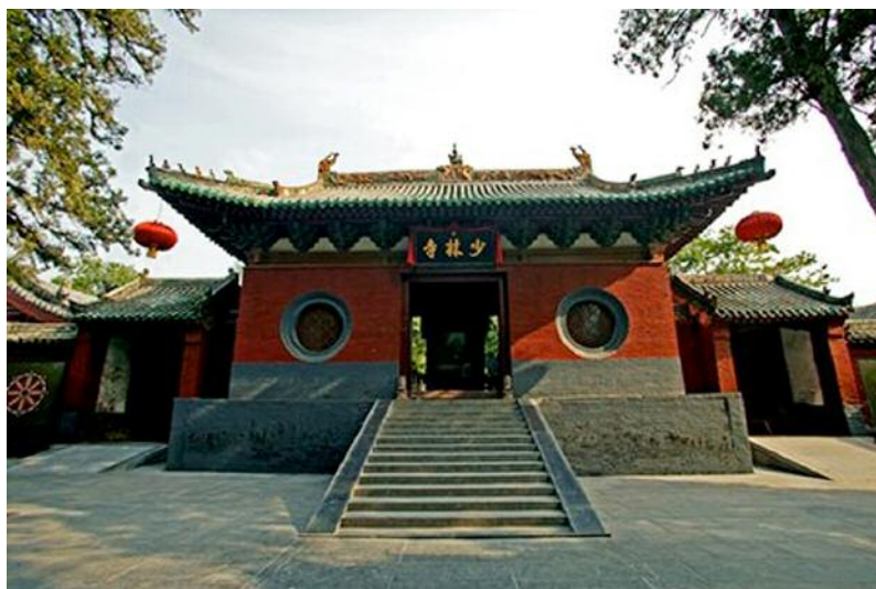
La Porta della Montagna nel monastero di Shaolin (nella provincia di Henan)