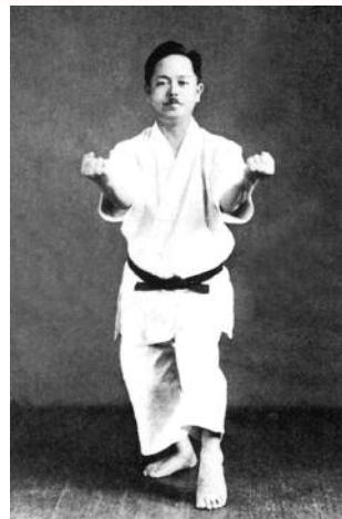
Kenwa Mabuni (1889-1952)

Chojun Miyagi (1888-1953), che nel 1921 aveva partecipato alla dimostrazione davanti al principe Hirohito nel castello di Shuri, visitò più volte la Cina e conobbe molte scuole di boxe cinese, ma studiò anche gli stili interni: creò il goju («duro-morbido»), uno stile basato sui principi dello yin e dello yang , affine al Naha-te. Insegnò in Giappone e alle Hawaii (1934) e fu nominato rappresentante di Okinawa nell'Associazione di Arti Marziali del Grande Giappone, il Dai Nippon Butokukai. Miyagi era stato allievo di Kanryo Higaonna e fu maestro di Gogen Yamaguchi, detto “il Gatto” (1909-1989). Morì a Naha l'8 ottobre 1953.