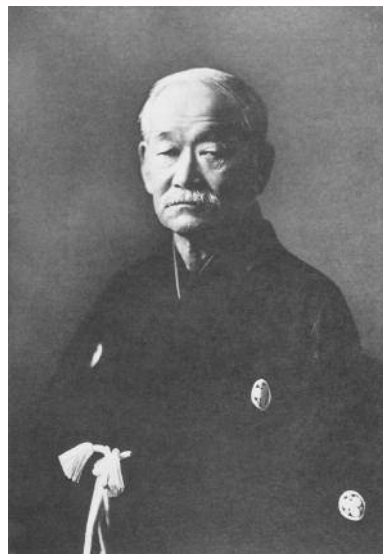
Jigoro Kano (1860-1938)