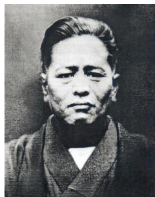
Chojun Miyagi (1888-1953)