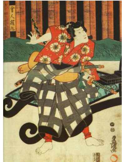
Samurai, di Kunisada